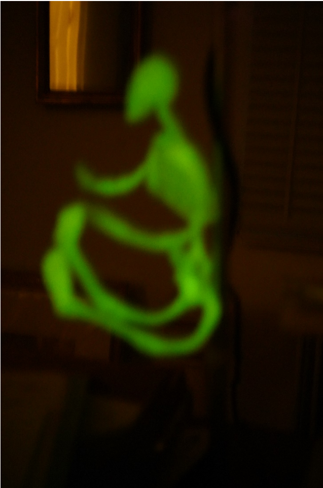
Helene von Oldenburg , My Friend , 2020, Foto auf Acrylglas, 80 x 120 cm.

Es bewegt sich, wenn man nicht hinsieht.