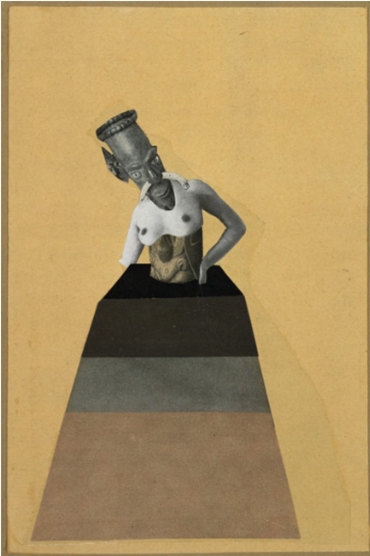
Hannah Höch, Ohne Titel , aus der Serie Aus einem ethnographischen Museum , 1929. https://www.artsy.net/artwork/hannah-hoch-ohne-titel-aus-der-serie-aus-einem-ethnographischen-museum-untitled-from-the-series-from-an-ethnographic-museum (24.06.21).