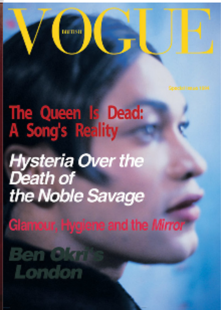
Iké Udé, Cover Girl Series , 1994. https://ikeude.com/cover-girl-1994/ (24.06.21).