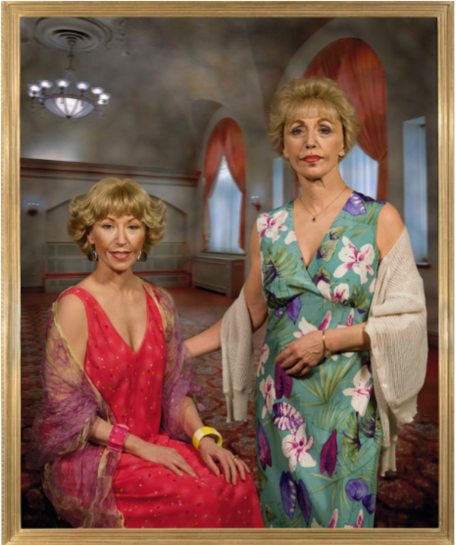
Cindy Sherman , Untitled #475 , 2008. https://spruethmagers.com/exhibitions/cindy-sherman-cindy-sherman-berlin/ (24.06.21).