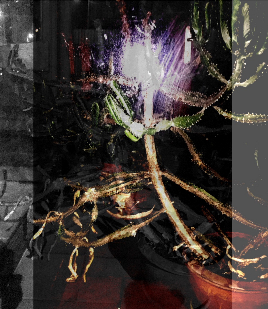
Claudia Reiche , le flash , Paris 2016; Photomontage, variable Größe, 2021.

Kakteen, die an prominentem und vergessenem Platz schon sehr lang überlebt zu haben scheinen. Blüten im Millisekundentakt.