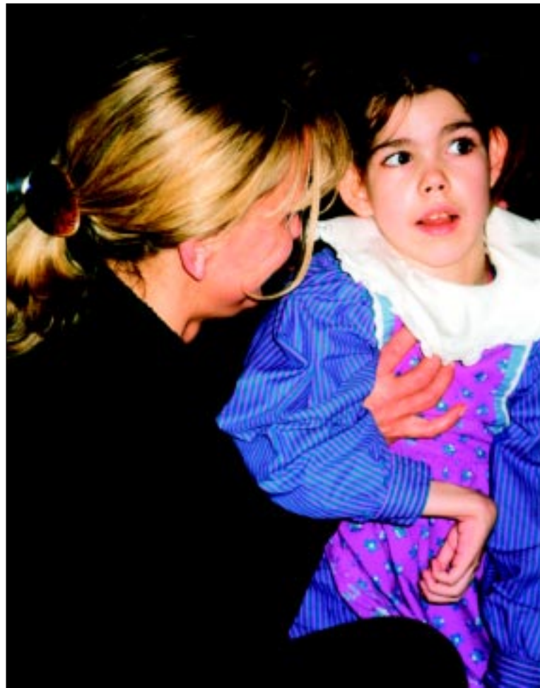
You are welcome!

The REHAPLAN Project Office, part of the Institute for Special Education, Prevention and Rehabilitation at the University of Oldenburg in Northern Germany, is focused on the situation of families with disabled children. The basic orientation of the center is towards the Scandinavian concept of normalization, which has been further developed in Oldenburg, and which seeks to establish help as a community-based project. The methods and early results of a model project for the whole of Germany will be presented as an example. This project is aimed at the development of better regional support systems.